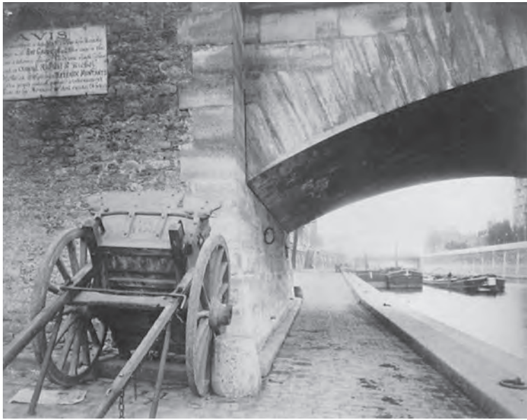
Eugène ATGET Un Coin de quai de la Tournelle (1910-1911)