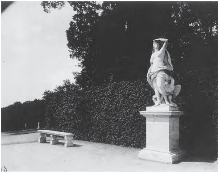
Eugène ATGET Versailles, parc (1901)