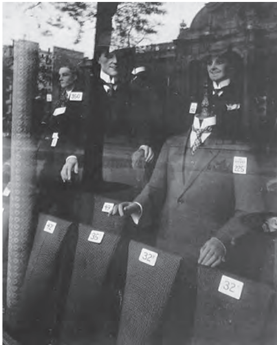
Eugène ATGET Shop, avenue des Gobelins (1925)