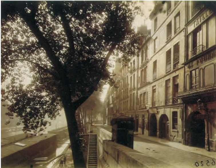
Eugène ATGET Quai d'Anjou, 6. a.m. (1924)