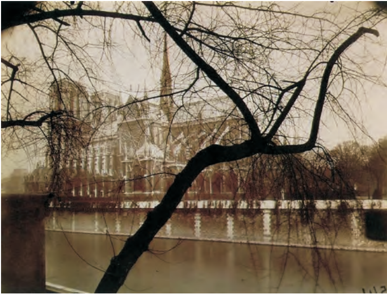
Eugène ATGET Notre Dame (1925)