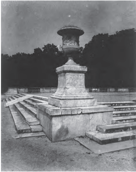
Eugène ATGET Versailles (1905)