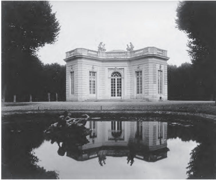
Eugène ATGET Trianon (1923-1924)