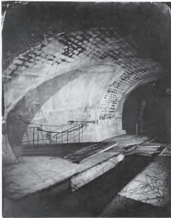
NADAR The Sewers (1864-1865)