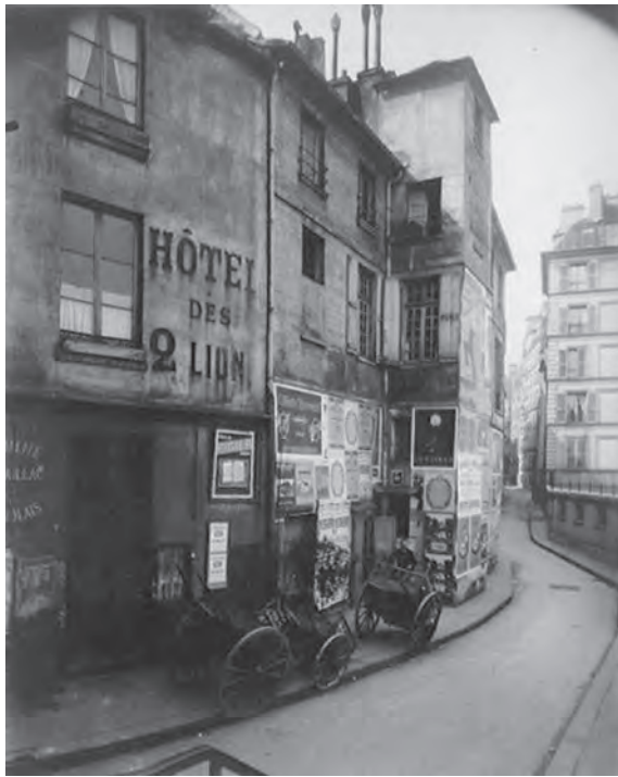
Eugène ATGET Rue des Ursins (1923)