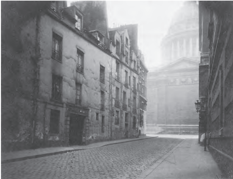
Eugène ATGET Coin de la Rue Valette et Pantheon (1925)