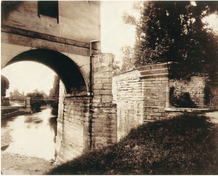
Eugène ATGET Charenton, vieux moulin (1915)